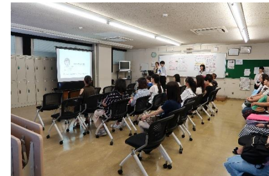
学生によるポートフォリオ学習 プレゼン中