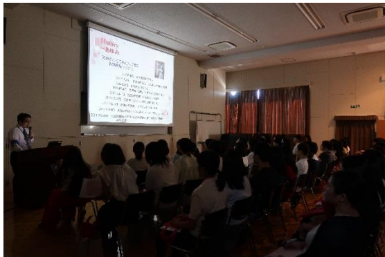
今年初 学生による全体説明会

全体説明会も模擬体験も ビブリアバトルも ポートフォリオ学習のプレゼンも ゼーンぶ学生たち主体で行われました～！