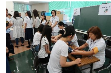
学生たちが優しく誘導、説明の模擬体験