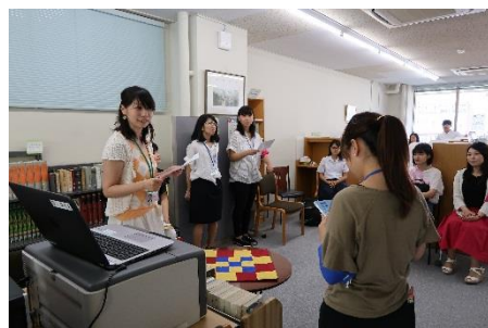
学生によるビブリアバトル発表中