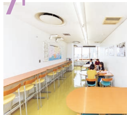
ブラウジングルーム