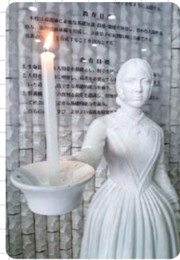
ナイチンゲール像