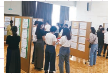
プレゼンテーション