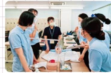
グループでのポートフォリオ学習