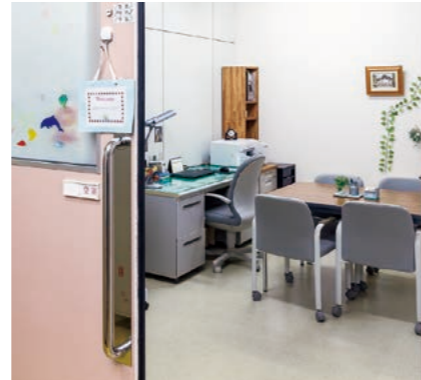
学生相談室・キャリア支援室

インターネットにより各種教材も検索でき、初心者でも簡単に操作できるようシステム設計されています。