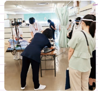
モデル人形を使った体験