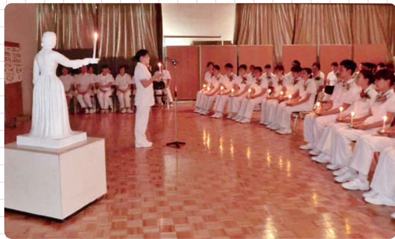
あじさい式(宣誓式)