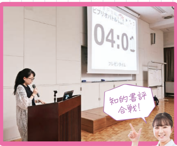
全校生による闘病記のビブリオバトル